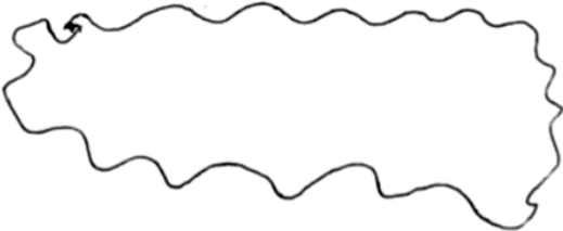
Bouche en action