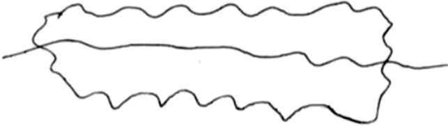
Bouche + malangue