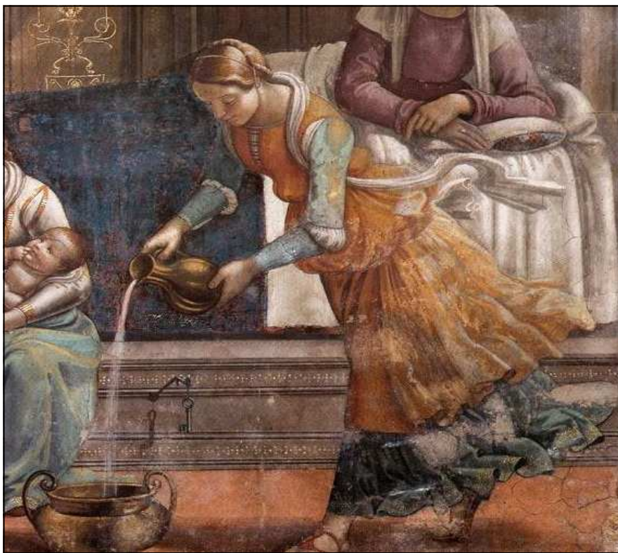
La Naissance de la Vierge, fresque de Domenico Ghirlandaio ; 1485/1490. (Florence, église Santa Maria Novella ; détail.)

Comment rendre compte de cette multiplicité d'intrications de temps différents, comment dire la réminiscence, la survivance ? Par les regroupements, les recoupements, par une combinatoire d'images, par un jeu de métamorphoses. Par le montage car la mémoire est monteuse, elle travaille avec l'hétérogène, le fait mouvoir et l'assemble. À la fin de sa vie, Warburg se livre à ce travail de montage qu'il appelle Mnémosyne , constitue ce qu'il nomme un Atlas qui rassemble un grand nombre de tables. Au lieu d'une présen-