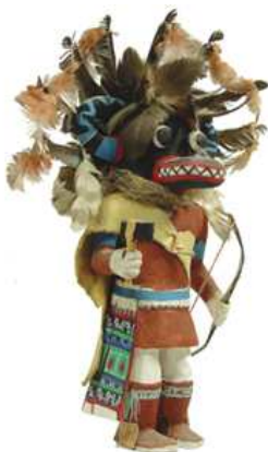
Exemple de katchina hopi.

G. Didi-Huberman ajoute : « Placer l'image au cœur du temps, n'est-ce pas en perdre le fil (...) ? » Plus loin est évoqué « (...) l'incontrôlable de tout ce qu'implique le mot " image " : fantasme et fantaisie notamment 10 (...) ». »