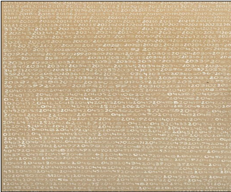
Suite de nombres peinte sur toile de Roman Opalka (1931-2011). Matérialisation du temps avec la peinture...

delaire. Même négation sur l'inconnu que sur l'infini. Une négation exclut une proposition en ouvrant un champ de possibilités. Je dis que 2 + 2 = 5 est une proposition fautive. Le faux reconnu comme faux me fait entrer dans le domaine du vrai. Mais je peux dire aussi que 2 + 2 = 31 est une proposition tout aussi fautive. Le vrai n'est pas l'exact. Par élimination méthodique d'un ensemble de propositions fautes, je vais parvenir à l'exact 2 + 2 = 4 . Mais cette élimination se fera dans un domaine de connaissance prédéterminé, c'est-à-dire fini, c'est-à-dire encore conceptuel. Le vœu de Baudelaire « au fond de l'inconnu pour trouver du nouveau » confronte à une perspective en abîme, l'exigence de l'absolue nouveauté, le sentiment