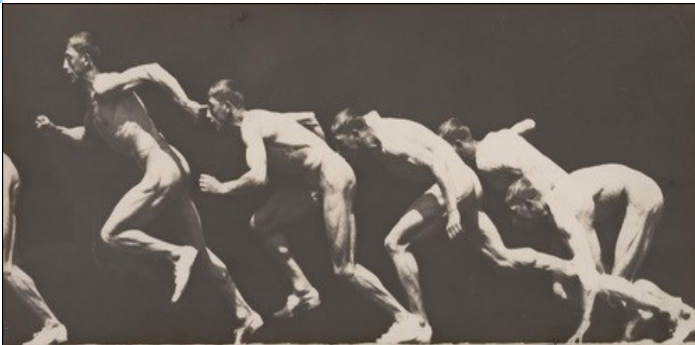
Chronophotographie, Georges Demeny (1850-1917)

plate, qu'il y a certes des astres mobiles mais que tout s'arrête aux étoiles fixes ; qu'y a-t-il au-delà de ces étoiles fixes ? Rien. Le néant est identique à l'infini, sorte de milieu indéterminé dont il n'y a rien à faire ni à penser. Il n'y a pas, dans l'antiquité, de problématique de l'Art. L'Art est imitation, reproduction. Il relève de technicités plus ou moins précises.