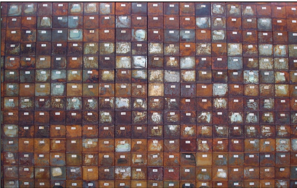
Mur de boîtes métalliques (empilées et numérotées comme au crématorium...) de l'exposition Personnes , Christian Boltanski au Grand Palais, Monumenta 2010.

du vivant, ce qui permet de prolonger la vie, de limiter la souffrance et même de modifier le vécu psychique (usage des antidépresseurs). Une chimie très subtile apparaît, étudiant l'infinimental du métabolisme. Cependant, il faut bien avouer