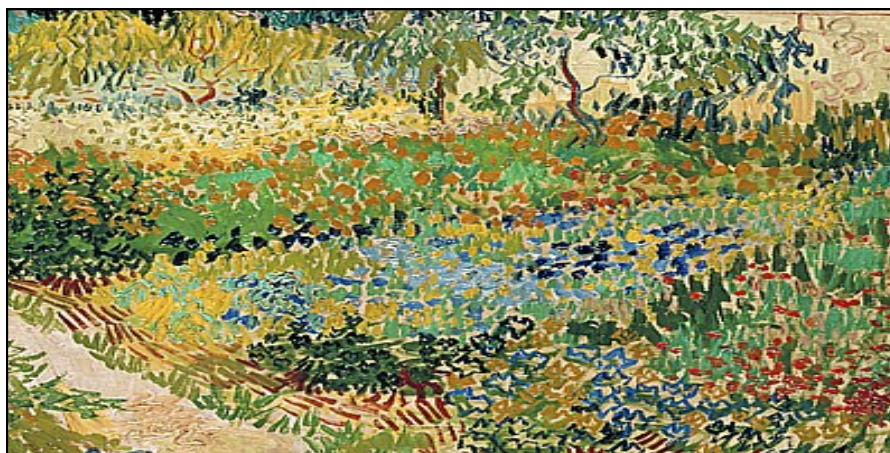
Enclos au jardin de Vincent van Gogh (détail) ; huile sur toile (1888).

a-t-il de commun entre les œuvres impressionnistes des peintres et l'œuvre de Proust, tout entière de langage ? La mutation ontologique qui oppose la modernité à l'antiquité manifeste le passage d'une ontologie de la chose opaque, lourde, à une ontologie de la transparence et de la relation. Le corps de l'être humain a longtemps été conçu comme une chose, limitée par la peau, que la mort rendait inerte ; c'est cette conception qui exi-